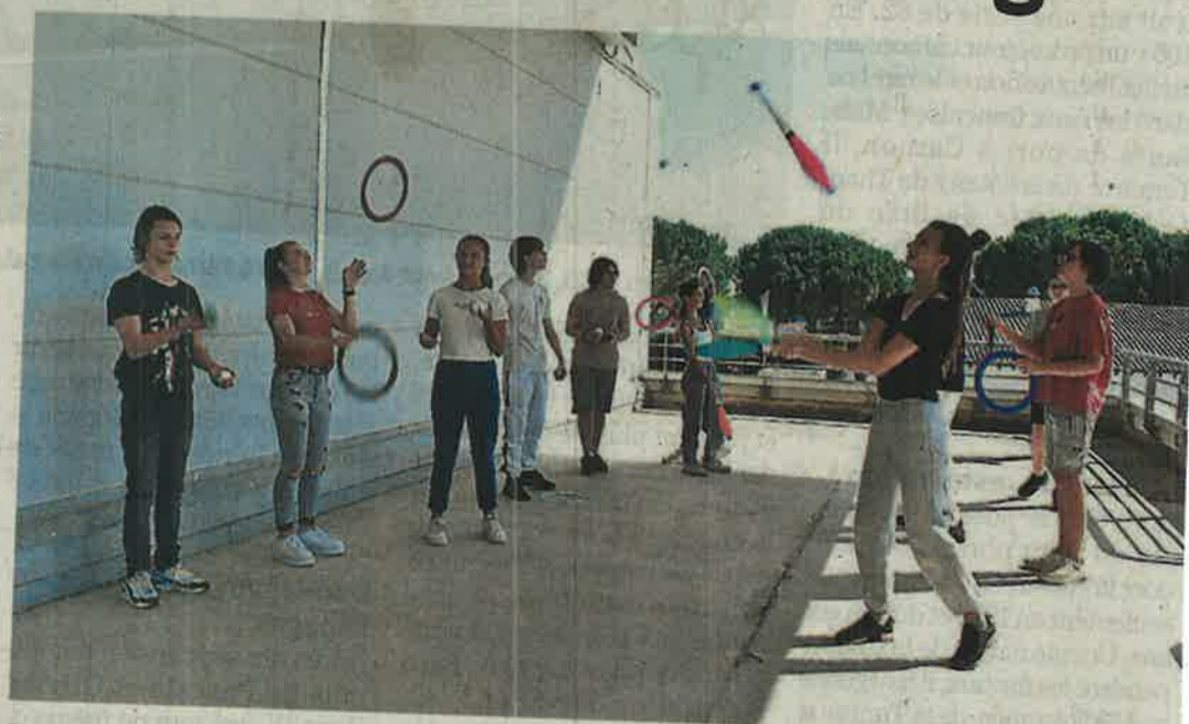
En trois jours, une centaine d'élèves s'est essayée à l'art de la jonglerie avec les artistes de Balthazar.