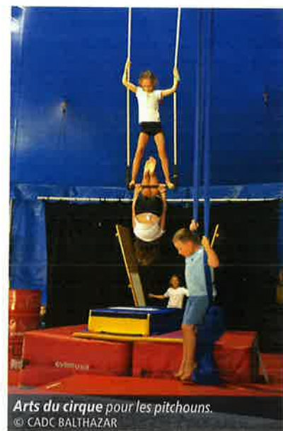
Arts du cirque pour les pitchouns.