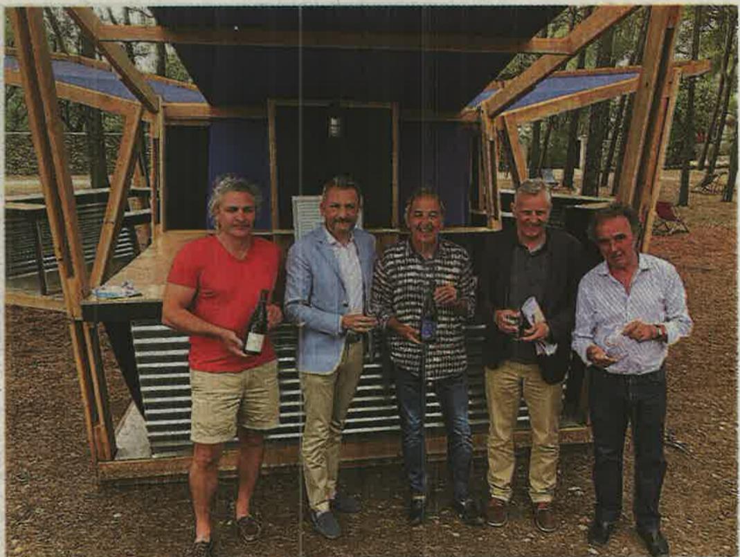
Le vin à l'honneur au Domaine d'O, avec la valeur "famille" en ligne de mire.

Parents, enfants sont conviés à venir festoyer autour des valeurs de la vigne. Un programme spécial a été mis en place pour les plus petits, avec des ateliers sur le jus de raisin, l'eau aromatisée, le recyclage. Côtés vignerons, ils seront 48 répartis sur les trois dates. Pour débuter vendredi soir, Picpoul de Pinet, Terrasses du Larzac, les appellations Montpeyroux et Saint-Drézéry, Pic-Saint-Loup viendront ravir les convives, avec des producteurs locaux de mets du terroir. Le tout autour de la danse et des