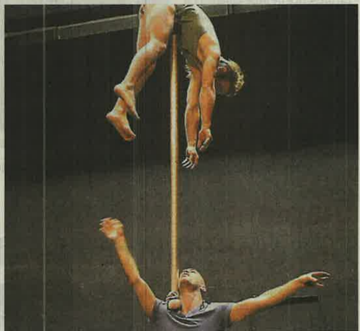
"De bonnes raisons" au Domaine d'O.

Oui, il y a toujours ce paradoxe. La joie enfantine de mettre nos corps à l'épreuve. C'est toujours ça la quête. Attention, c'est un