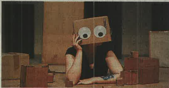
"Voyage en absurdie", le spectacle du mercredi après-midi.

La Boule , un porté acrobatique (à partir de 6 ans) sera joué également dimanche 1 er octobre à