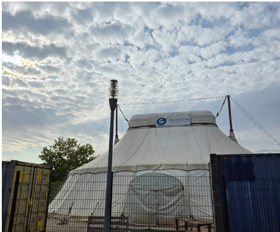
Le chapiteau d'entrainement