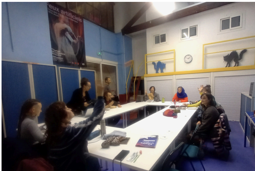
Un temps pédagogique

La mise en place de modules complémentaires est possible !