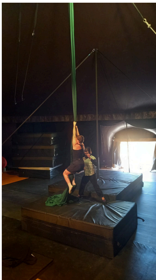
Une séance d'entraînement sous chapiteau